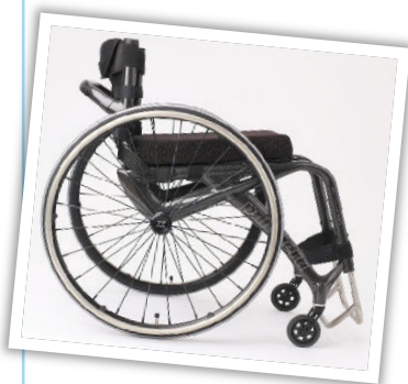
Tekst: S. Reemet

Tänapäevased LED-tehnoloogiad vahetavad välja energiamahukad hõõglampid. LED-valgustite poolt tarvitatav energia on minimaalne, aga valgusjõud hõõglampidega võrreldes suurem.