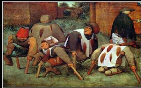
EESTI LIIKUMISPUUDEGA INIMESTE LIIT

Kuidas kõik alguse sai... Pieter Bruegel, Sandid, 1568, õli