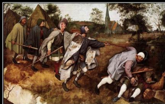
EESTI PIMEDATE LIIT

Kuidas kõik alguse sai... Pieter Bruegel, Sandid, 1568, õli