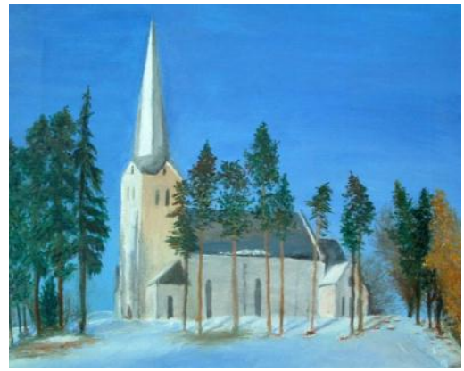
Meelis Luks, "Püha Peetri kirik", õli 2009, 41x33 cm