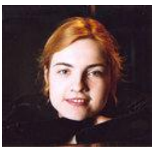
AGE JUURIKAS on õppinud

Kontsert kestab orienteeruvalt tunni. Tund enne ja tund pärast kontserti saab juttu puhuda ja muljeid vahetada klubiruumis kohvitassi seltsis.